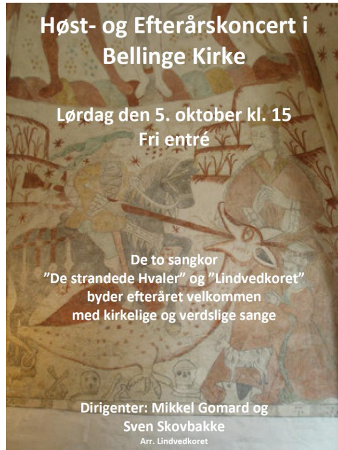
Kalkmaleri fra Bellinge kirke – Sct. Jørgen og dragen