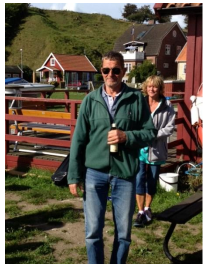
Belena sørgede for bøjen kom ind