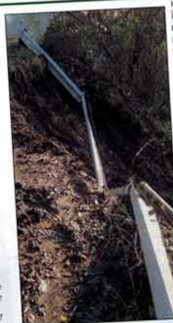
segue a pag. 2

Nell'autunno del 2000, altri 6 fenomeni franosi interessarono altrettante vie collinari; le cause sempre imputabili alle