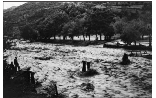
L'Alpone a san Giovanni Ilarione in una esondazione del 1938.

gli alvei dei nostri corsi d'acqua eliminando la vegetazione che cresce all'interno ostacolando il corretto fluire delle acque, rinforzare gli argini e costruirne di adeguati dove mancano.