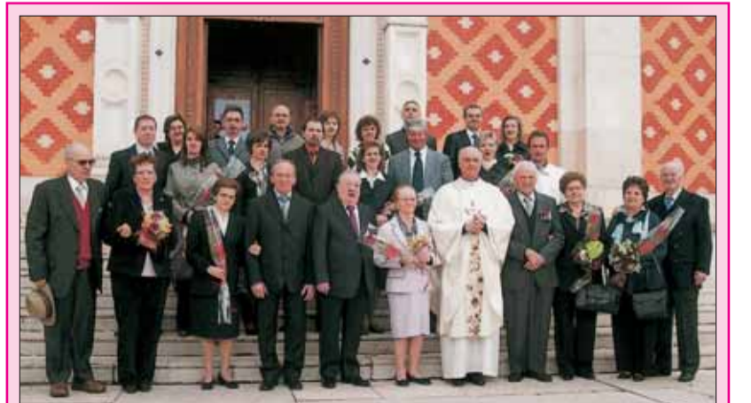
Anniversario di matrimonio: 25-50-60-65 anni insieme, un bel esempio per le future coppie, con tanti auguri.