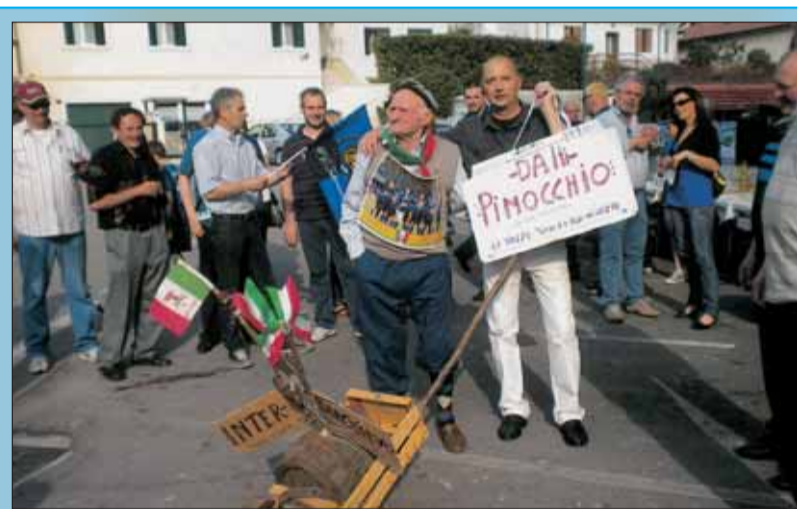
FESTA INTER 2010. Piazza del Popolo, il popolo interista si è riunito per festeggiare lo scudetto. Foto di Angelo Biondaro classe 1920!!!!