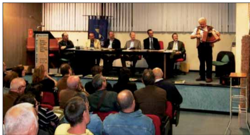
L'esibizione di Otello durante la serata del giovedì.

Il lunedì mattina l'appuntamento con le scuole all'interno del capannone dell'artigianato: alcune maestre hanno illustrato agli scolari delle elementari "Energia Alternativa risparmio energetico", a cui è seguita la dimostrazione pratica della lavorazione del formaggio, molto apprezzata dagli studenti soprattutto per gli assaggi finali. Alla sera la sagra è ripresa con l'orchestra spettago-