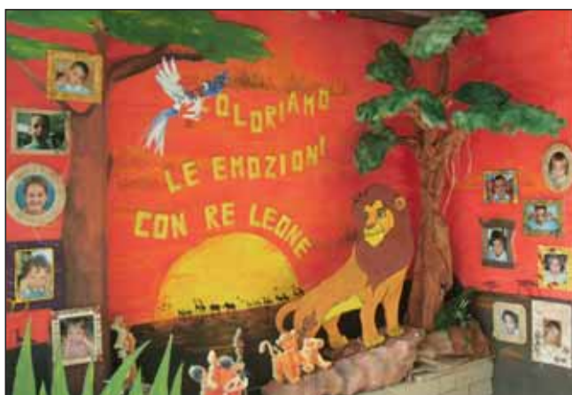
In alto: il lavoro terminato! A destra: i bambini con le maschere.

La scuola materna "Papa Luciani" presenta il percorso educativo per l'anno scolastico 2010/2011