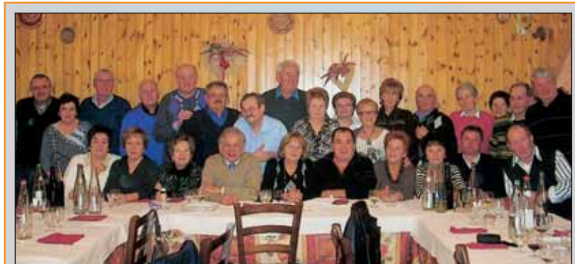
Classe 1947 soddisfatti della vita vissuta ma ancora pimpanti per il futuro. W la classe!!!