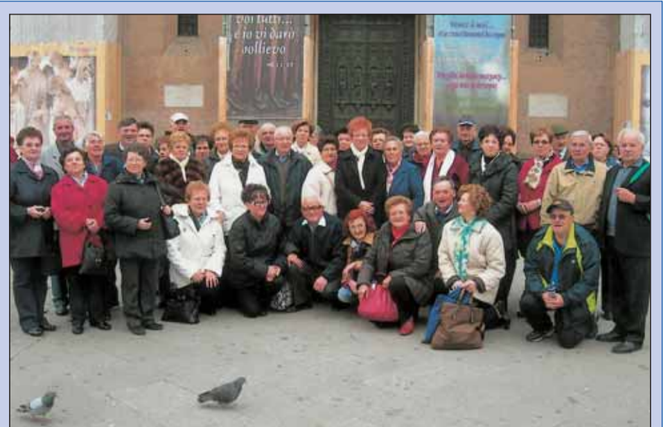
Gita annuale della Lega Pensionati F.N.P., C.I.S.L. di San Giovanni al Santo di Padova.