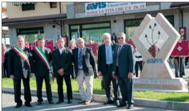
Inaugurazione Monumento al Donatore, 12.09.2010.

Primo, l'inaugurazione del monumento al Donatore di Sangue. Nato da un'idea di un nostro consigliere e, vista la volontà del Direttivo, si è arrivati al compimento di quest'opera realizzata per testimonianza pubblicamente la riconoscenza verso i tanti donatori che, in 42 anni di attività della nostra Associazione, hanno saputo porgere il braccio nel nobile gesto della Donazione del sangue, fonte di vita, energia e speranza che si trasmette a chi riceve questo prezioso bene che non si può produrre in laboratorio o con altri artifici ma si può solo Donare. Questo nuovo monumento è la rappresentazione dell'essenza stessa della solidarietà nelle sue linee raffiguranti un grande abbraccio che simboleggia l'amore del