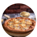
Four Cheese Pizza